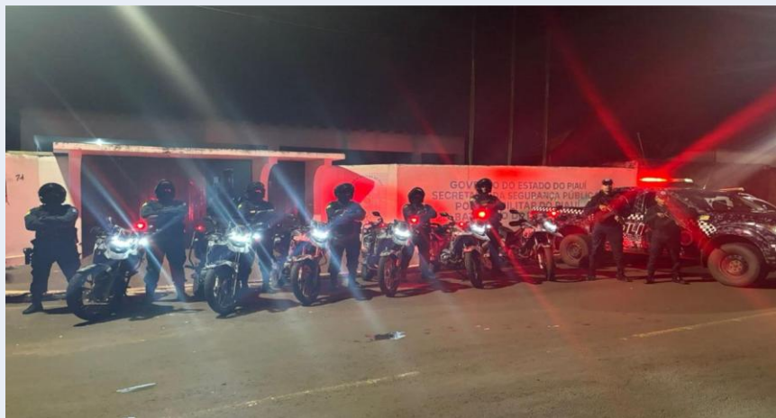
Operação Planejada – Segurança Intensiva · 04/04/2026