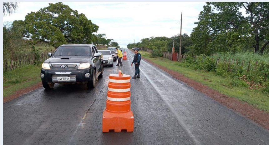
Operação Trânsito Seguro (25º BPM + BPRE) · 16 e 17/04/2026