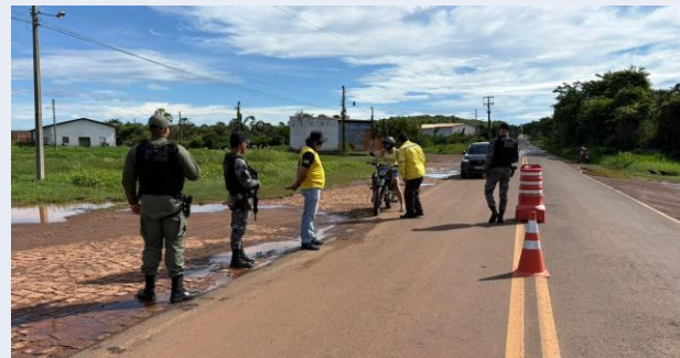
Blitz na zona rural · 15/02/2026