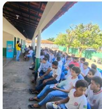
Palestra na Escola São Raimundo Nonato – Localidade Lagoa Seca, Esperantina, PI.

DMTRANS + 25º BPM: planejamento de blitz no acesso ao Parque Ecológico Cachoeira do Urubu.