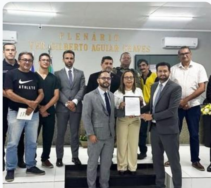
Audiência Pública Interinstitucional em Defesa da Vida

Compromisso com a transparência e o aprimoramento contínuo das políticas de trânsito.