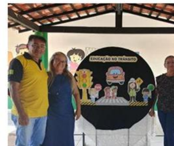
Palestra na Escola São Raimundo Nonato – Lagoa Seca