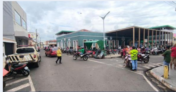
DMTRANS no Mercado Público · Nov./2025

Estradas da área rural com ênfase no uso de capacete