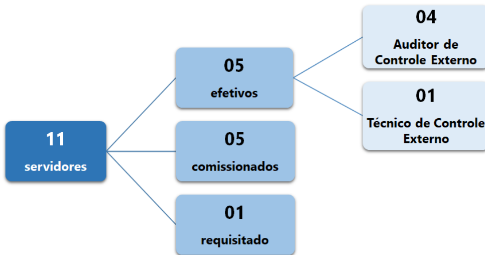
Figura 2 - Quantitativo de servidores da DFPESSOAL 3

Quanto à distribuição das funções entre servidores da divisão, informa que quando os processos chegam, são imediatamente distribuídos a todos, independentemente do assunto (aposentadorias, pensões e reformas). Todos os servidores, com exceção de uma Técnica, analisam processos de concessão de benefícios.