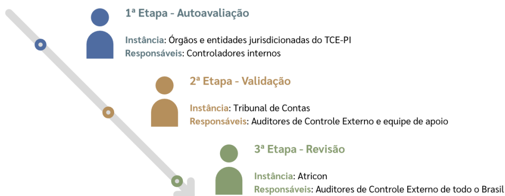
Figura 1 – Esquema das etapas do PNTP

Confira no Quadro a seguir as datas previstas para cada etapa: