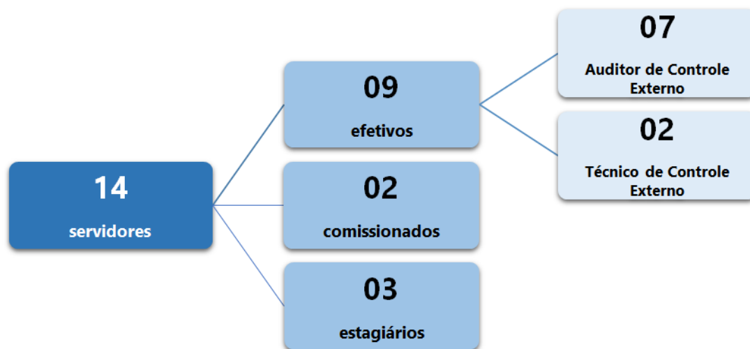
Figura 2 - Quantitativo de servidores da DFCONTAS 4